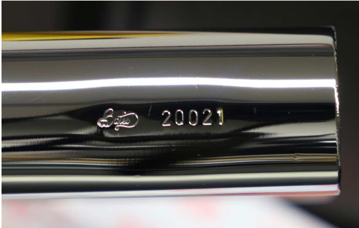
Beispiel einer Kennzeichnung