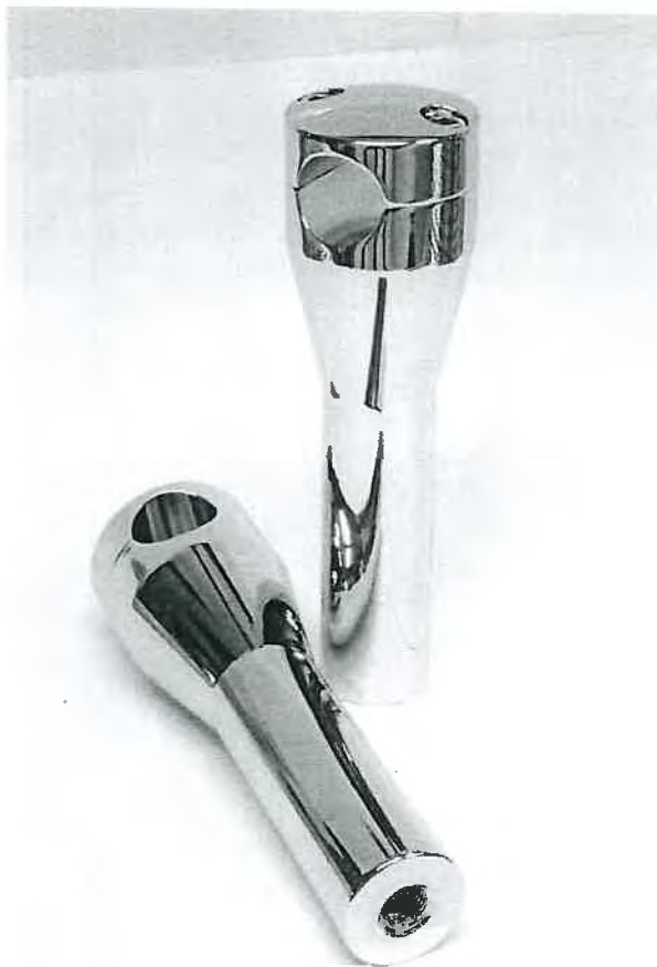
Lenkerhalter, Typ WW-Riser AL