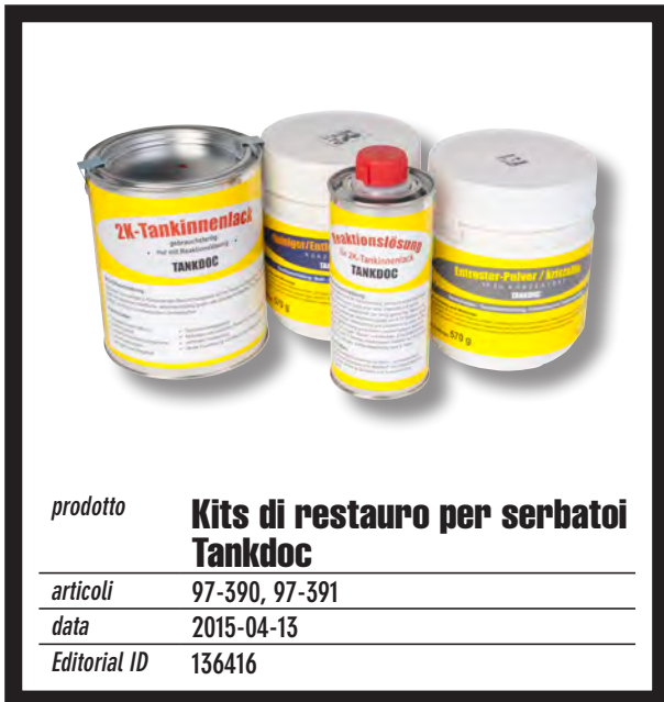
prodotto Kits di restauro per serbatoi Tankdoc articoli 97-390, 97-391 data 2015-04-13 Editorial ID 136416

I prodotti chimici vanno conservati in luogo chiuso a chiave e fuori dalla portata dei bambini.